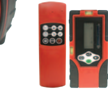
リモコン・受光器 標準装備

赤色レーザーに比べて約5倍(当社比)明るいグリーンレーザーを採用。 緑色は赤色に比べて比視感度が高く、視認性も抜群です。